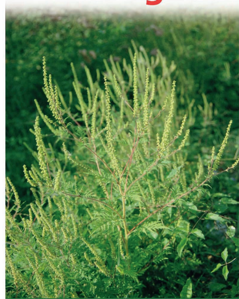
AMBROISIE A FEUILLES D'ARMOISE