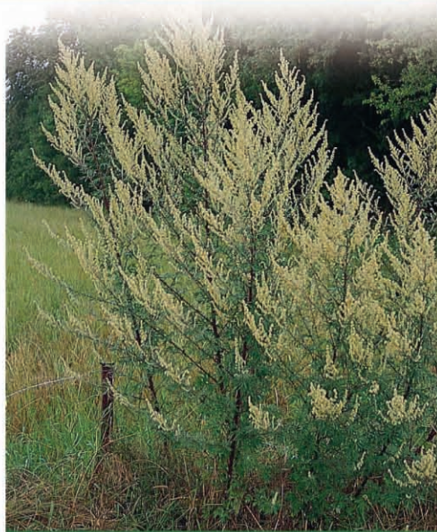
ARMOISE VULGAIRE EN FLEUR

Observatoire des ambrosiées, d'après DDAS Rhône